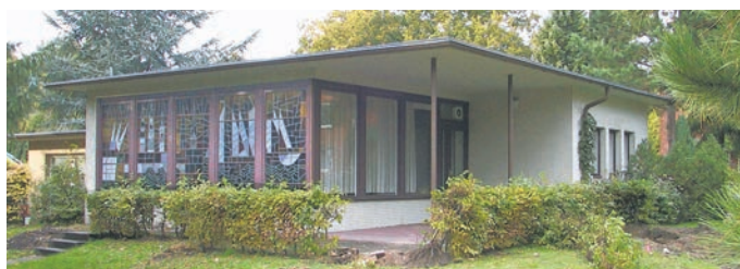
Von 1959 bis 2005 war das Fenster ein Teil des Gemeinschaftsraumes der LVA-Siedlung Stoltenstraße

HORN Die 20. Folge unserer Serie in Zusammenarbeit mit der Geschichtswerkstatt Horn zeigt dieses Mal den Weg eines „historischen Objektes“: Um die Wohnungsnot der Rentner zu lindern, baut die Landesversicherungsanstalt Hamburg Ende der 1950er-Jahre 128 Wohnungen an der Stoltenstraße/Ecke Manshardtstraße in Horn.